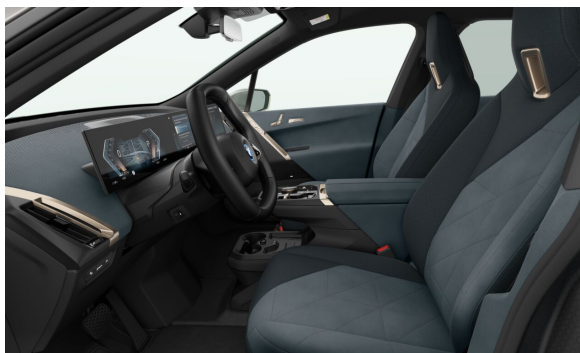
FSBJG Design interiéru Loft Stone Grey