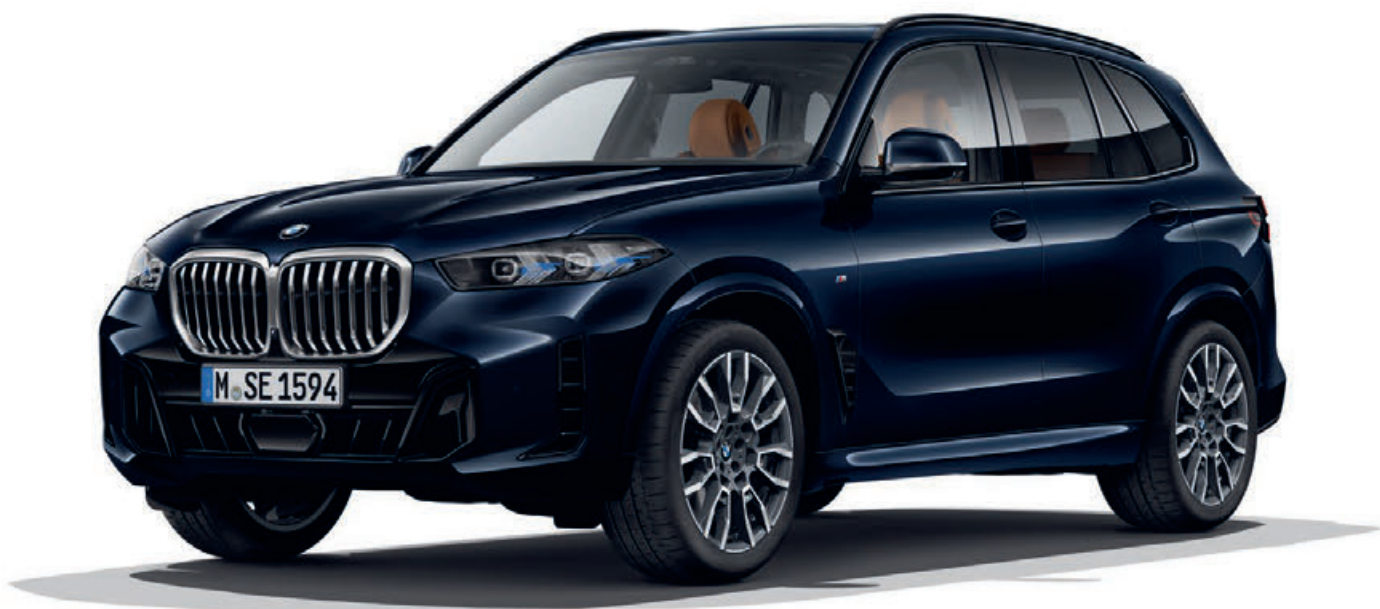
337 - M sportovní paket - BMW X5 xDrive40i, metalický lak M Carbon Black (volitelná výbava), 21" M kola z lehké slitiny V-spoke 915 M Bicolour (volitelná výbava)