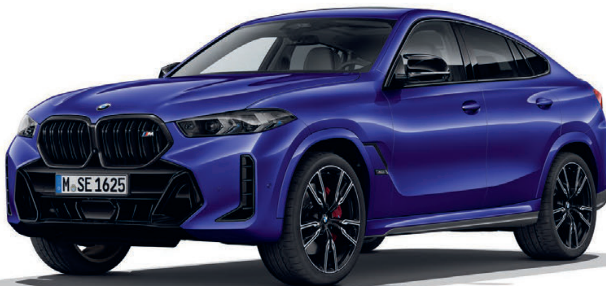
33B – M sportovní paket Pro – BMW X6 M60i xDrive, lak BMW Individual Velvet Blue (volitelná výbava), 22" M kola z lehké slitiny V-spoke 747 M Bicolour s kombinovanými pneumatikami Black (volitelná výbava)