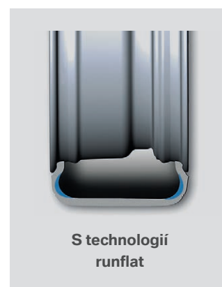
S technologií runflat