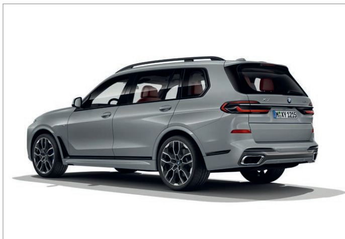
BMW X7 xDrive40i, M Shadowline černé vysoce lesklé okenní lišty a koncovky výfuku specifické pro M sportovní paket

Obrázky jsou ilustrativní. Změny v obsahu, jakož i tiskové chyby a omyly jsou vyhrazeny.