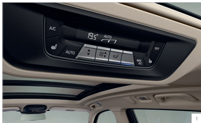
4NN – 5zónová automatická klimatizace