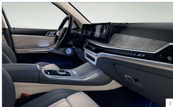
4NM – Paket Ambient Air

Obrázky jsou ilustrativní. Změny v obsahu, jakož i tiskové chyby a omyly jsou vyhrazeny.