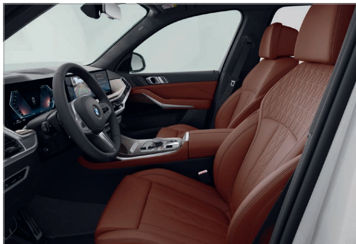
BMW Individual kůže Merino s rozšířeným obsahem "Tartufo / Black" (volitelná výbava), Dřevěné obložení interiéru Fineline Black s metalickým efektem, vysoce lesklé (volitelná výbava)