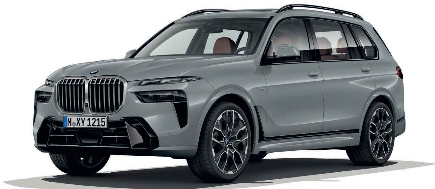
BMW X7 xDrive40i, Skyscraper Grey (šedá) (volitelná výbava), 22" M kola z lehké slitiny V-spoke 755 M (volitelná výbava)