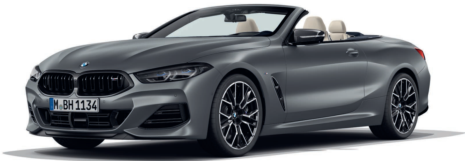
BMW 840d xDrive