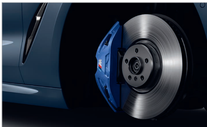
2NH – M sportovní brzdy