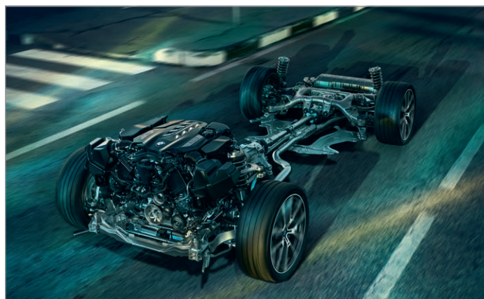
2VW – Adaptivní M podvozek Professional

Obrázky jsou ilustrativní. Změny v obsahu, jakož i tiskové chyby a omyly jsou vyhrazeny.