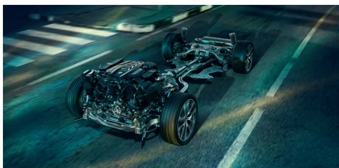
2VW – Adaptivní M podvozek Professional

Obrázky jsou ilustrativní. Změny v obsahu, jakož i tiskové chyby a omyly jsou vyhrazeny.