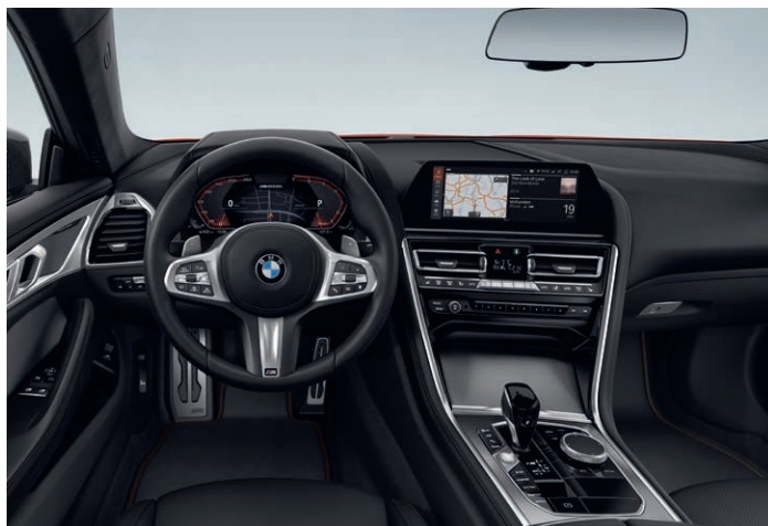
Kůže Merino s rozšířeným obsahem