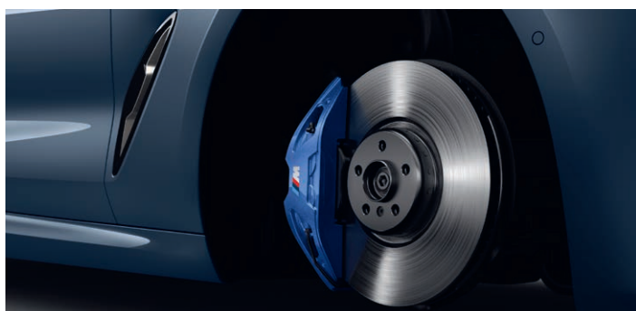
2NH – M sportovní brzdy