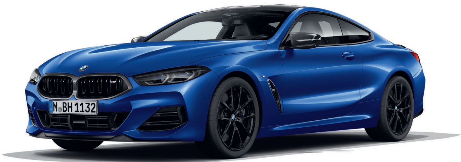
BMW 840d xDrive Coupé