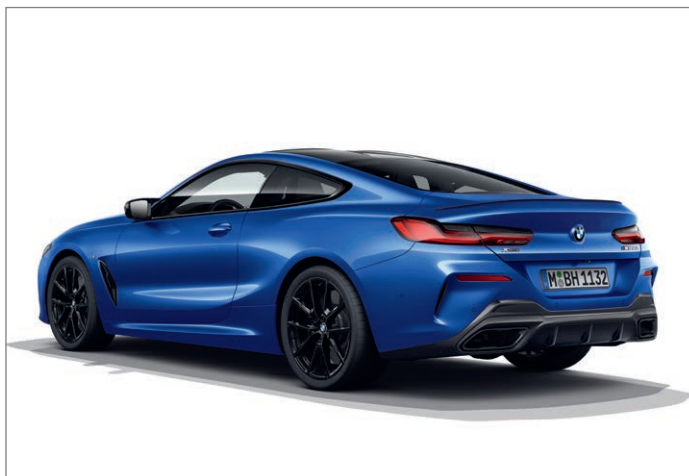
BMW 840d xDrive Coupé

Obrázky jsou ilustrativní. Změny v obsahu, jakož i tiskové chyby a omyly jsou vyhrazeny.