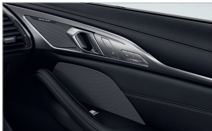
688 – Harman Kardon Surround Sound System