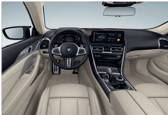
BMW Individual kůže Merino s rozšířeným obsahem