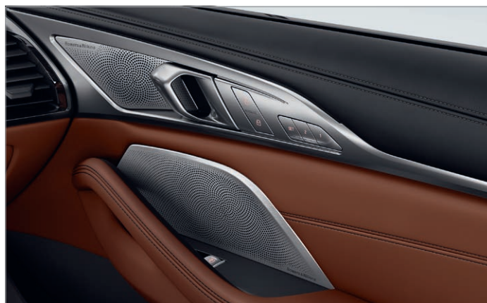
6F1 – Bowers & Wilkins Diamond Surround Sound System

Obrázky jsou ilustrativní. Změny v obsahu, jakož i tiskové chyby a omyly jsou vyhrazeny.