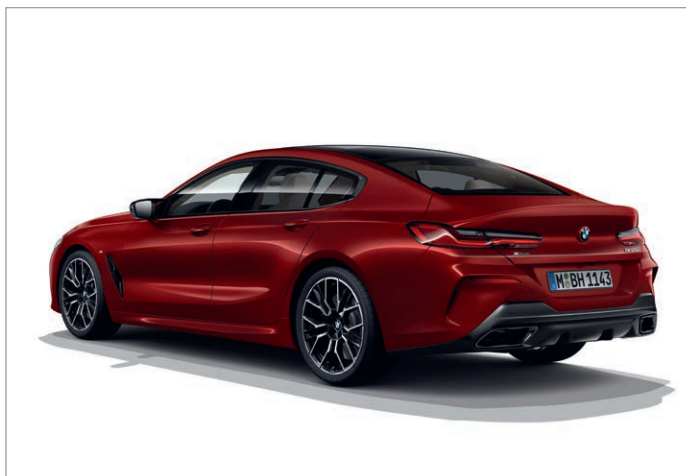
BMW 840i Gran Coupé, zadní difuzor v provedení Dark Shadow

Obrázky jsou ilustrativní. Změny v obsahu, jakož i tiskové chyby a omyly jsou vyhrazeny.