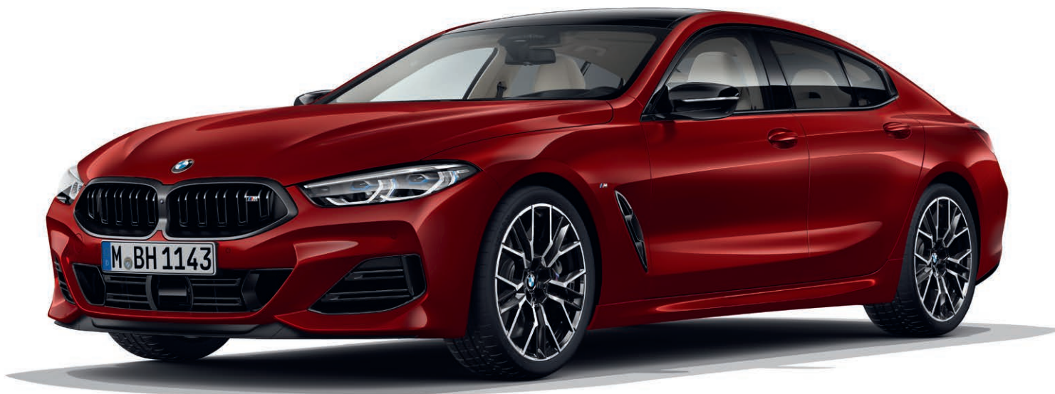
BMW 840i Gran Coupé